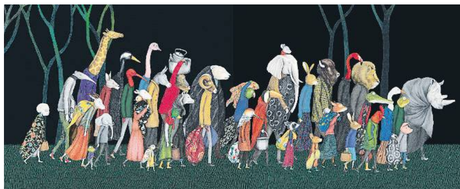
EDITORIAL LIBROS DEL ZORRO ROJO