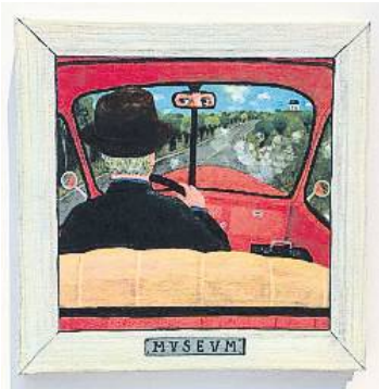
EDITORIAL FULGENCIO PIMENTEL

Amants dels còmics, del cinema i de les arts plàstiques, dissenyadors, il·lustradors... són el perfil dominant entre el públic adult de l'àlbum